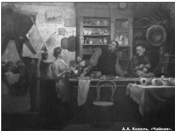
А.А. Кокель. «Чайная».

Международная научно-практическая конференция стала значимой вехой в упрочении чувашско-российско-украинских культурных связей.